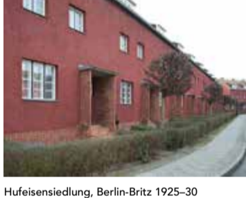
Hufeisensiedlung, Berlin-Britz 1925-30