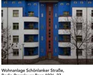
Wohnanlage Schönlanke Straße, Berlin-Prenzlauer Berg 1926-27