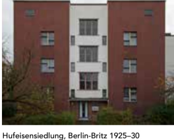
Hufeisensiedlung, Berlin-Britz 1925-30