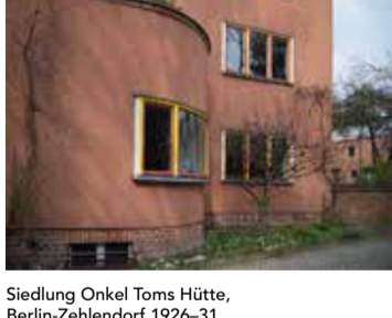
Siedlung Onkel Toms Hütte, Berlin-Zehlendorf 1926-31