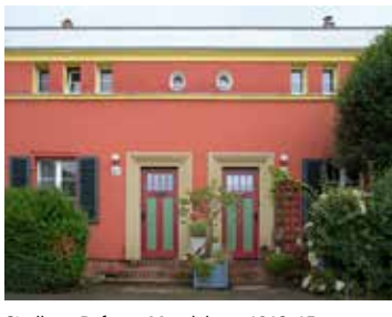
Siedlung Reform, Magdeburg 1912-15