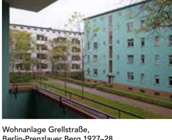
Wohnanlage Grellstraße, Berlin-Prenzlauer Berg 1927-28