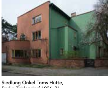
Siedlung Onkel Toms Hütte, Berlin-Zehlendorf 1926-31