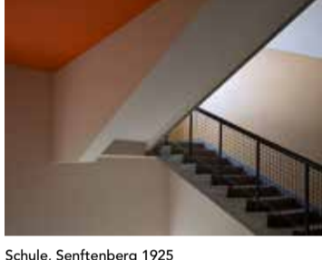
Schule, Senftenberg 1925