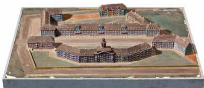
Wohnanlage Fischerstraße Kaiserslautern, Gipsmodell 1919–26