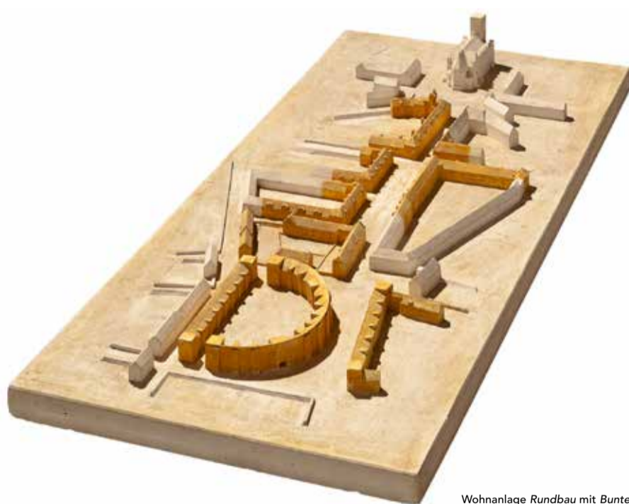
Wohnanlage Rundbau mit Buntem Viertel Kaiserslautern, Gipsmodell 1926–28

DIE AUSSTELLUNG IST EIN PROJEKT DES LEHRGEBIETS GESCHICHTE UND THEORIE DER ARCHITEKTUR, PROFESSOR DR. MATTHIAS SCHIRREN, TU KAISERSLAUTERN, WWW.GTA-KL.DE. SIE WURDE UNTERSTÜTZT VON DER BAU AG KAISERSLAUTERN. SIE FINDET STATT IN DEN RÄUMEN DER ARCHITEKTURGALERIE KAISERSLAUTERN, EINER INITIATIVE DER KAMMERGRUPPE KAISERSLAUTERN DER ARCHITEKTENKAMMER RHEINLAND-PFALZ IN ZUSAMMENARBEIT MIT DEM FACHBEREICH ARCHITEKTUR DER TU KAISERSLAUTERN.