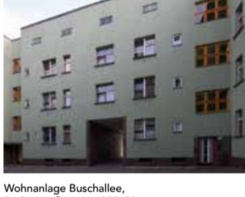
Wohnanlage Buschallee, Berlin-Weißensee 1925-30