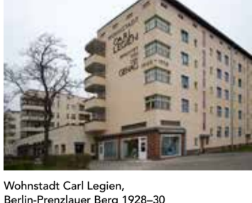
Wohnstadt Carl Legien, Berlin-Prenzlauer Berg 1928-30