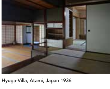
Hyuga-Villa, Atami, Japan 1936