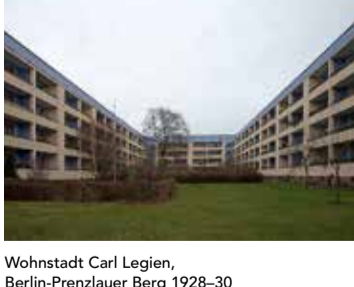
Wohnstadt Carl Legien, Berlin-Prenzlauer Berg 1928-30