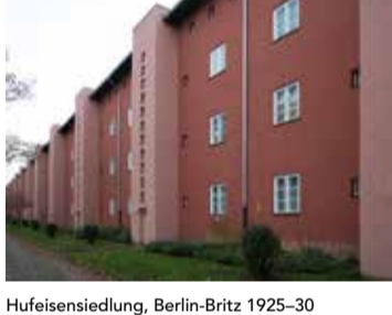
Hufeisensiedlung, Berlin-Britz 1925-30