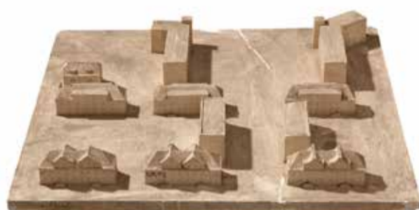
Bebauung Mannheimer Straße Ecke Donnersbergstraße Kaiserslautern, Gipsmodell 1920er Jahre