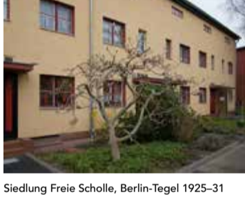
Siedlung Freie Scholle, Berlin-Tegel 1925-31