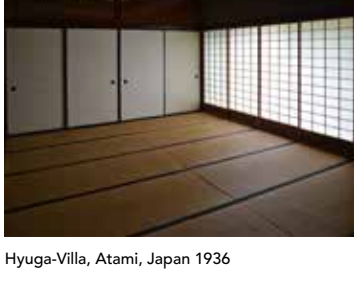
Hyuga-Villa, Atami, Japan 1936