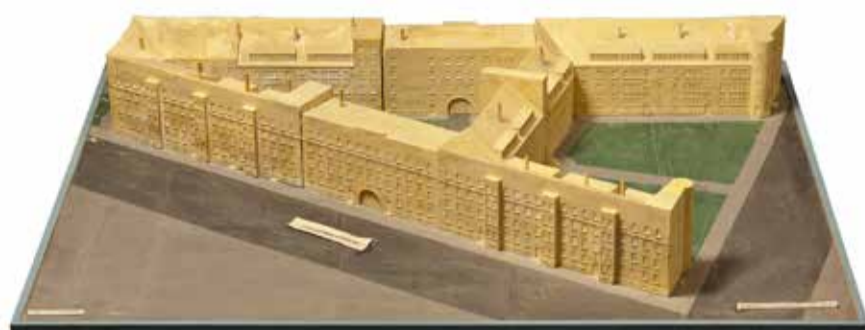
Wohnanlage Grüner Block Kaiserslautern, Gipsmodell 1926–28