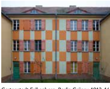
Gartenstadt Falkenberg, Berlin-Grünau 1913-16