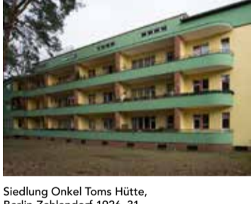
Siedlung Onkel Toms Hütte, Berlin-Zehlendorf 1926-31