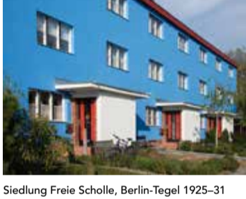
Siedlung Freie Scholle, Berlin-Tegel 1925-31