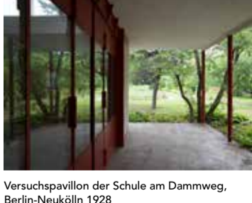
Versuchspavillon der Schule am Dammweg, Berlin-Neukölln 1928