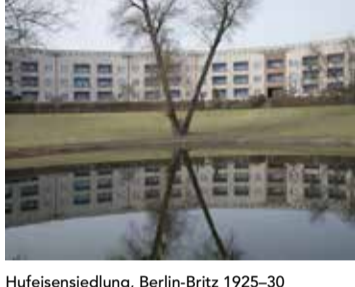
Hufeisensiedlung, Berlin-Britz 1925-30