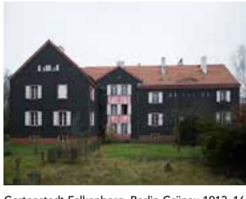
Gartenstadt Falkenberg, Berlin-Grünau 1913-16