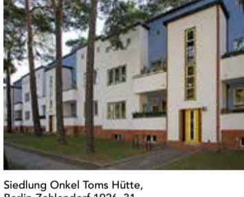
Siedlung Onkel Toms Hütte, Berlin-Zehlendorf 1926-31