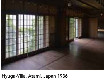
Hyuga-Villa, Atami, Japan 1936