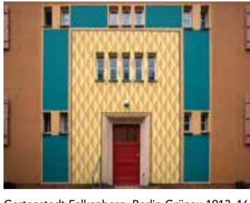
Gartenstadt Falkenberg, Berlin-Grünau 1913-16