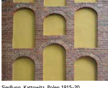
Siedlung Kattowitz, Polen 1915-20