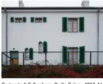
Gartenstadt Falkenberg, Berlin-Grünau 1913-16