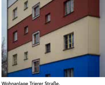
Wohnanlage Trierer Straße, Berlin-Weißensee 1925-26