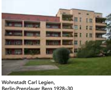
Wohnstadt Carl Legien, Berlin-Prenzlauer Berg 1928-30