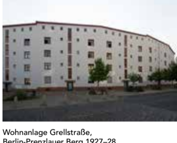
Wohnanlage Grellstraße, Berlin-Prenzlauer Berg 1927-28