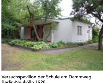
Versuchspavillon der Schule am Dammweg, Berlin-Neukölln 1928