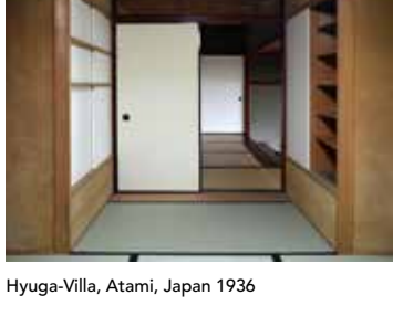
Hyuga-Villa, Atami, Japan 1936