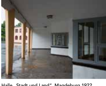
Halle 'Stadt und Land', Magdeburg 1922