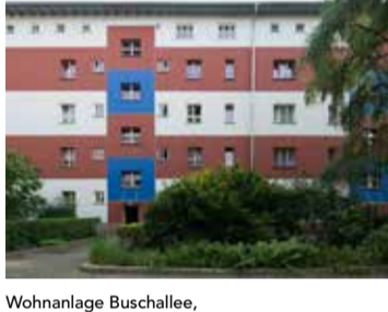
Wohnanlage Buschallee, Berlin-Weißensee 1925-30