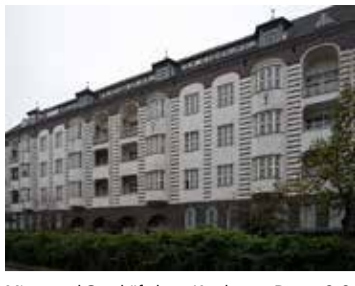
Miets- und Geschäftshaus Kottbuser Damm 2-3, Berlin-Neukölln 1910-11