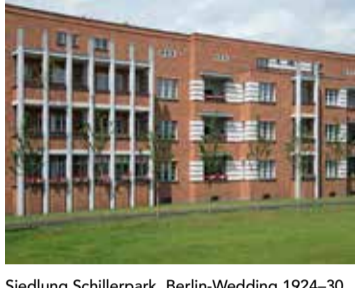
Siedlung Schillerpark, Berlin-Wedding 1924-30