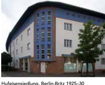
Hufeisensiedlung, Berlin-Britz 1925-30