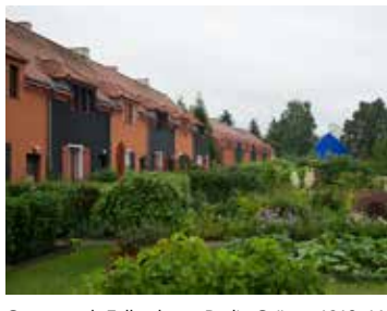
Gartenstadt Falkenberg, Berlin-Grünau 1913-16