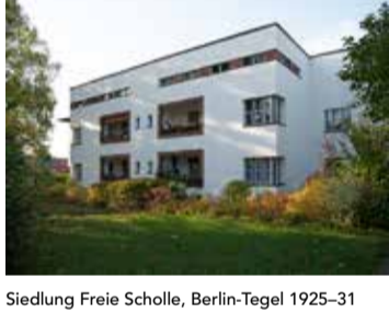
Siedlung Freie Scholle, Berlin-Tegel 1925-31