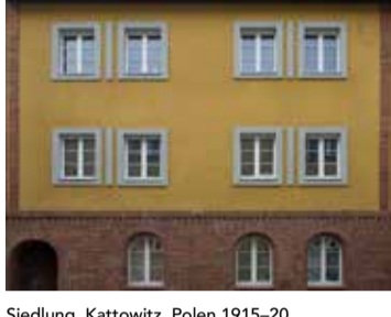
Siedlung Kattowitz, Polen 1915-20